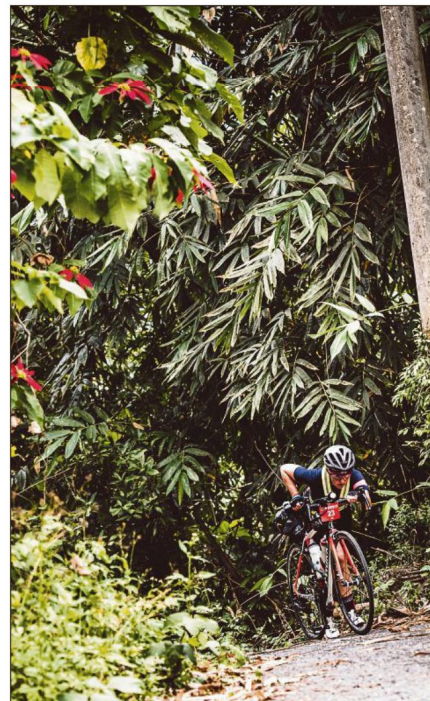
La sortie de la jungle pour un des concurrents de la BikingMan.