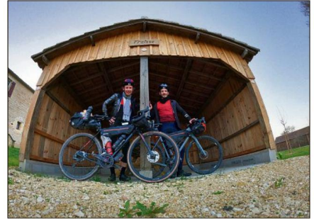
L'abri de pèlerin de Compostelle, à Fraisse, près de Bergerac, où les deux compères ont dormi.