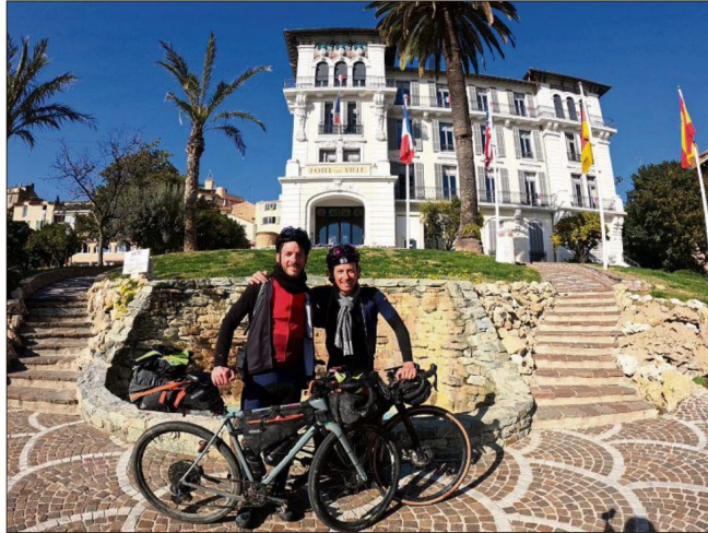
L'arrivée au Cannet le dimanche 28 février.

« J'ai toujours pratiqué beaucoup de sports comme le tennis, l'escalade, la gym, le judo, le badminton ou la danse. Mais ma passion pour